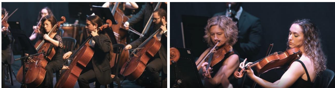
Concierto realizado durante el XII Congreso Notarial Español.

Cabe destacar que, a raíz de los primeros ensayos de la obra, el director de la orquesta, Yury Yanko , solicitó al autor incluir coros e imágenes durante la interpretación de la sinfonía para potenciar los sentimientos que transmite la obra. Así, los coros se interpretan en seis idiomas: alemán, francés, italiano, inglés, español y búlgaro; este último, por ser la base común de todas las lenguas eslavas.