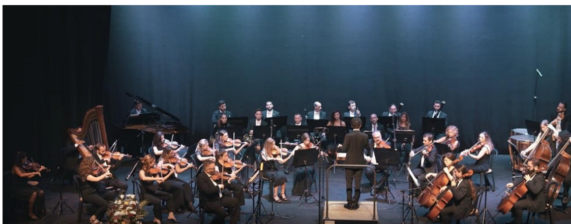
Concierto realizado durante el XII Congreso Notarial Español.