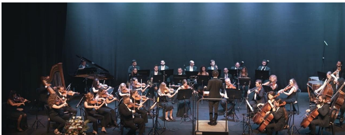
Concert realitzat durant el XII Congrés Notarial Espanyol.

La simfonia 'Aurora Europa', composta pel notari i compositor català Josep M a Valls , es va estrenar el mes de maig passat en el marc del XII Congrés Notarial Espanyol a Màlaga.