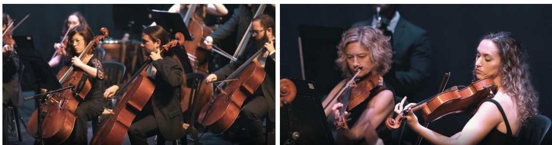
Concert realitzat durant el XII Congrès Notarial Espanyol.