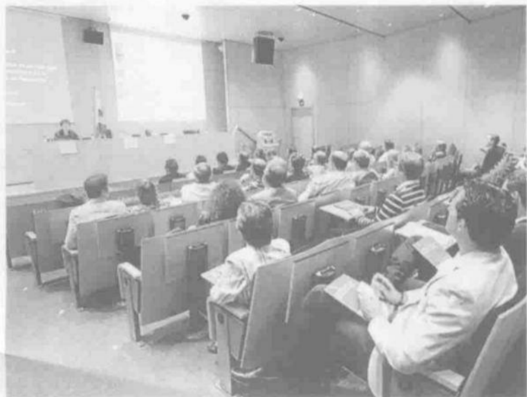
Asistentes al acto de Fira Sabadell