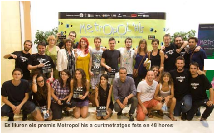
Es lliuren els premis Metropol'his a curtmetratges fets en 48 hores