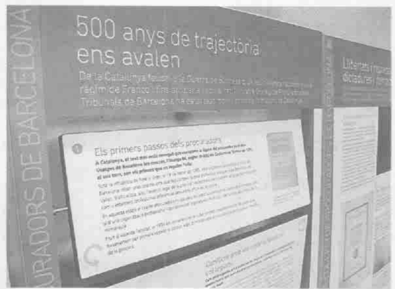
La mostra itinerante podrà veure a partir del pròxim lunes