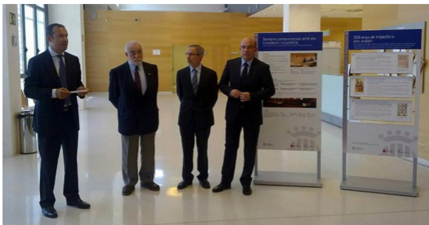
Inauguració de l'exposició, aquest dimecres al Jutjat de Granollers.

L'equipament judicial acull fins al divendres 8 de juny l'exposició sobre la història de l'ens